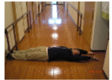
廊下の幅はこれくらい。床の色、材質、落ち 美く感じるとあっていいです