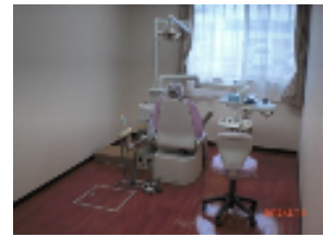
本格的な歯科診療台があります

榎本 そうですねー。海外で老人ホームを立ち上げたらいいですね。で、日本ではこういう接し方やけどほかの国ではどうとらえられ、どう受け入れられるのか、ということにはとっても興味がありますね。