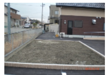
駐車場の隣の畑スペース。